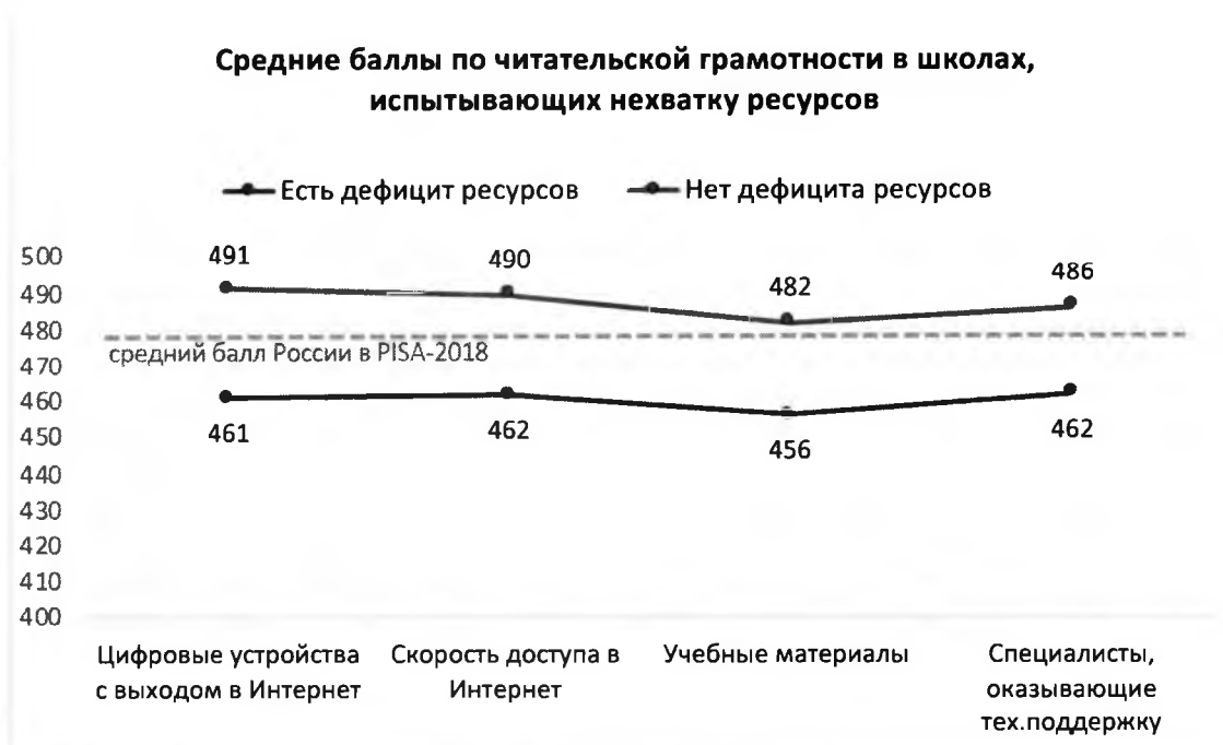
Рисунок 2. Дефициты ресурсов образовательной организации и результаты обучающихся по шкале читательской грамотности PISA относительно среднего результата РФ в PISA-2018

Дефициты ресурсов определялись на основании ответов администрации школ на вопросы анкеты и могут отражать субъективную точку зрения директора.