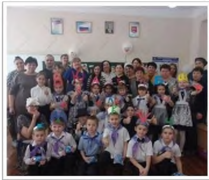
Соревнования «А ну-ка девушки».