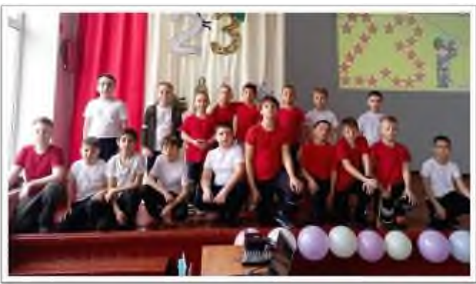
Соревнования по стрельбе из пневматической винтовки среди образовательных организаций Зерноградского района, посвященные Дню Защитника Отечества.