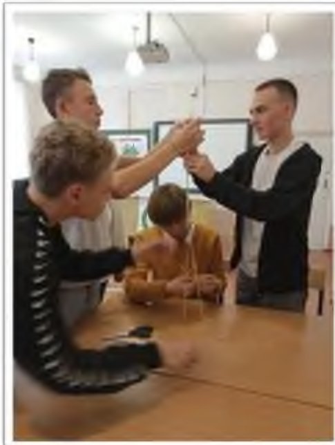
Всероссийская масштабная Акция "Наши семейные книги памяти".