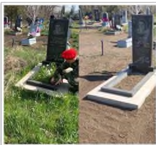
9 мая «Книги памяти».