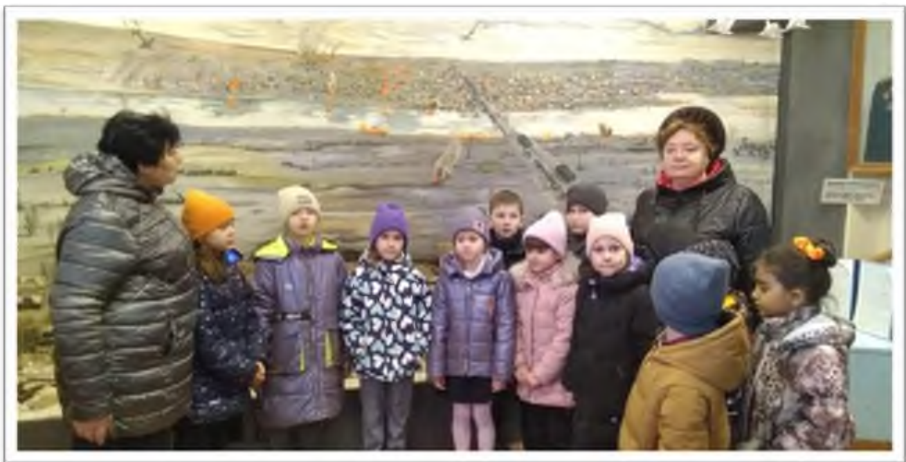
Акция «Всемирный день распространения информации о проблеме аутизма».