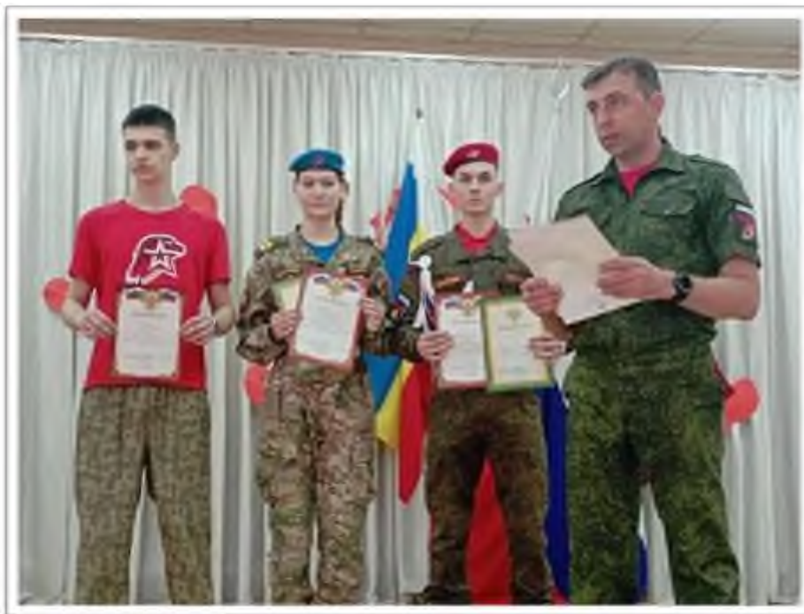
Трек «Орлёнок – Хранитель исторической памяти».