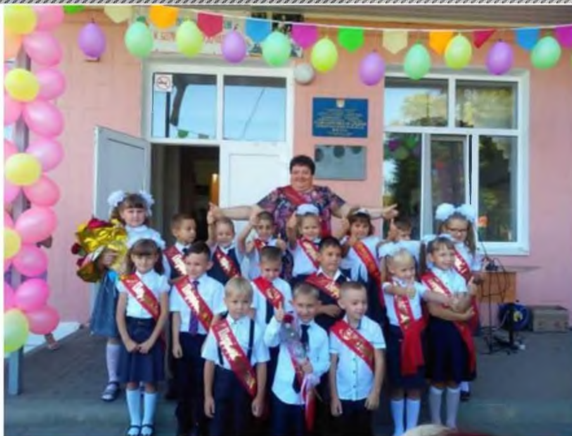
Линейка, посвященная Дню знаний