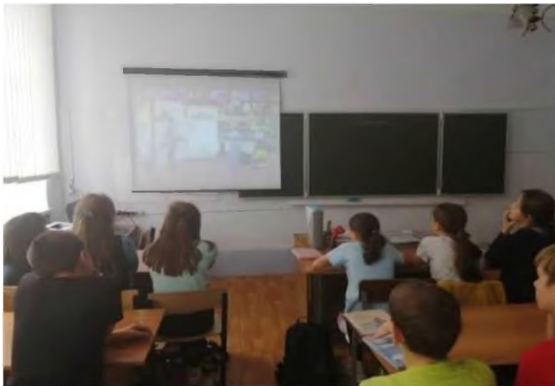
Всероссийский урок Эколята