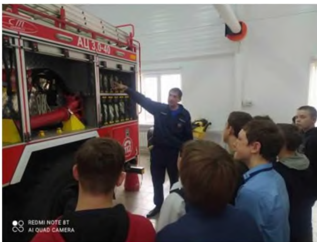
Экскурсия в пожар часть