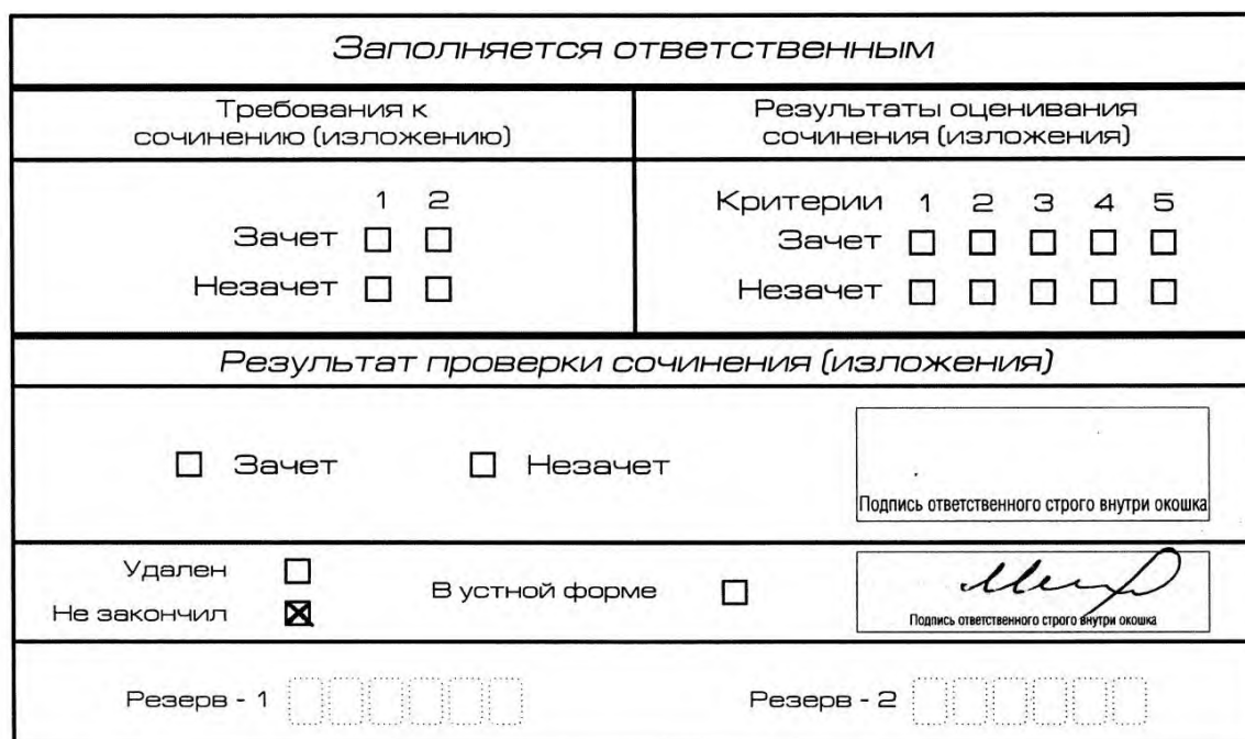
Рис. 12. Заполнение полей нижней части бланка регистрации (участник не закончил написание сочинения (изложения) по уважительным причинам)

В случае если участник итогового сочинения (изложения) по состоянию здоровья или другим объективным причинам не может завершить написание итогового сочинения (изложения), он может покинуть место проведения итогового сочинения (изложения). Члены комиссии по проведению итогового сочинения (изложения) составляют «Акт о досрочном завершении написания итогового сочинения (изложения) по уважительным причинам» (форма ИС-08), вносят соответствующую отметку в форму ИС-05 «Ведомость проведения итогового сочинения (изложения) в учебном кабинете ОО (месте проведения)» (участник итогового сочинения (изложения) должен поставить свою подпись в указанной форме). В бланке регистрации указанного участника итогового сочинения (изложения) необходимо внести отметку «Х» в поле «Не закончил» для учета при организации проверки, а также для последующего допуска указанных участников к повторной сдаче итогового сочинения (изложения) в дополнительные сроки. Внесение отметки в поле «Не закончил» подтверждается подписью члена комиссии по проведению итогового сочинения (изложения) (см. рис. 12).