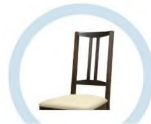
СПИНКИ СТУЛЬЕВ, НЕ ОБИТЫЕ ТКАНЬЮ И МЯГКИМ ПОРИСТЫМ МАТЕРИАЛОМ