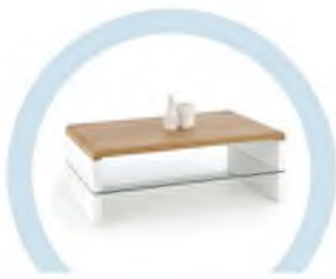
ЖУРНАЛЬНЫЕ СТОЛИКИ И ПРОЧИЕ ЖЕСТКИЕ ПОВЕРХНОСТИ