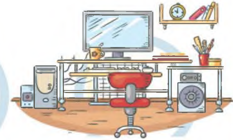
5. СООТВЕТСТВИЕ МЕБЕЛИ