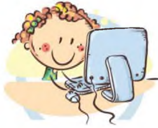
2. ПОЛОЖЕНИЕ МОНИТОРА