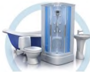
ТУАЛЕТ (УНИТАЗ, ВАННА, ДУШЕВАЯ КАБИНА, БИДЕ)