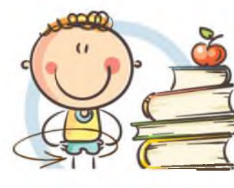
3. ФИЗКУЛЬТМИНУТКА ДЛЯ СНЯТИЯ УТОМЛЕНИЯ КОРПУСА ТЕЛА