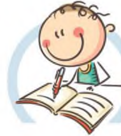
4. СИДИТЕ ПРАВИЛЬНО