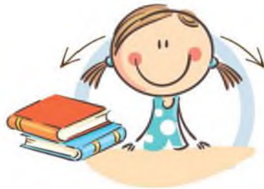
1. ФИЗКУЛЬТМИНУТКА ДЛЯ УЛУЧШЕНИЯ МОЗГОВОГО КРОВООБРАЩЕНИЯ