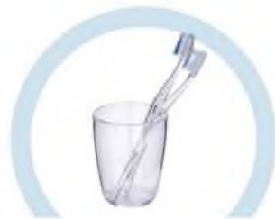
ТУАЛЕТНЫЕ ПРИНАДЛЕЖНОСТИ (ЗУБНЫЕ ЩЕТКИ, РАСЧЕСКИ И ПР.)