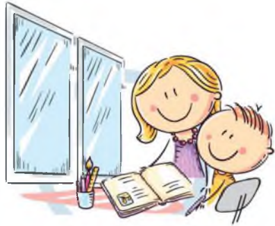
1. ЕСТЕСТВЕННОЕ ОСВЕЩЕНИЕ

ЕДИНЬИЙ КОНСУЛЬТАЦИОННЫЙ ЦЕНТР РОСПОТРЕБНАДЗОРА 8-800-555-49-43