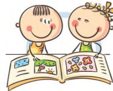
4. УПРАЖНЕНИЯ ГИМНАСТИКИ ГЛАЗ