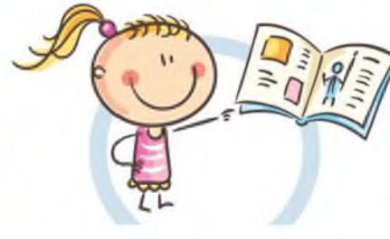
3. РАССТОЯНИЕ ДО КНИГ