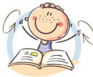
2. ФИЗКУЛЬТМИНУТКА ДЛЯ СНЯТИЯ УТОМЛЕНИЯ С ПЛЕЧЕВОГО ПОЯСА И РУК